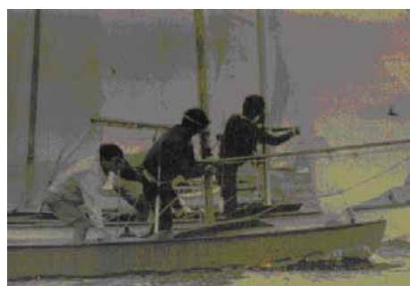
昭和45年5月16日インカレ。