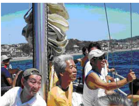
白髪の混じった懐かしい顔がそろいます。

ヨットは体が覚えています。自転車に乗るのと同じです。 そう・・・もう早くなくてもいいんです。 体力が衰えたと感じる今日この頃・・・。あの時代のことを、ヨットに乗って思い出して下さい。 そう・・・あの熱き青春の日々を。沈しても、息子・娘のような現役が助けてくれますから大丈夫！