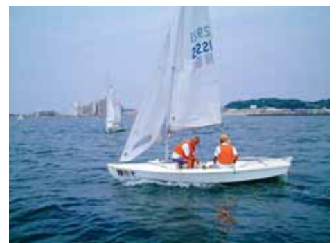
自信がなくても、古い方から乗ってもらいます。